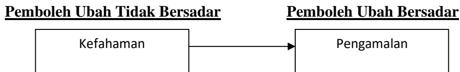
Rajah 1: Kerangka Konseptual bagi Pengaruh Kefahaman Terhadap Pengamalan Islam Saudara Muslim Tentera Darat Malaysia

Berdasarkan pernyataan masalah di atas, sebuah kerangka konseptual telah dihasilkan seperti rajah di bawah: