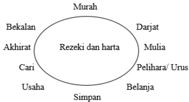
Rajah 1: Kata Kunci Rezeki dan Harta

Jika diperhatikan petikan ini memperlihatkan bahawa pengarang telah mengungkapkan nilai ilmu pendidikan menerusi watak si bapa yang menasihati anak-anaknya. Antara perkara yang disentuh berkaitan dengan perkara yang dicari oleh manusia iaitu rezeki yang murah, darjat yang mulia dan perbekalan untuk di akhirat. Malah, pencari rezeki perlulah pandai mencari harta, pandai memeliharakannya, pandai menjalankannya dan pandai membelanjakannya di tempat yang berfaedah, umpama menolong kaum kerabat, melapangi sanak saudara. Dalam hal ini, pengarang telah menitikkan dan menekankan bahawa manusia perlu bijak dalam mencari harta, menguruskan dan membelanjakannya pada tempat yang berfaedah.