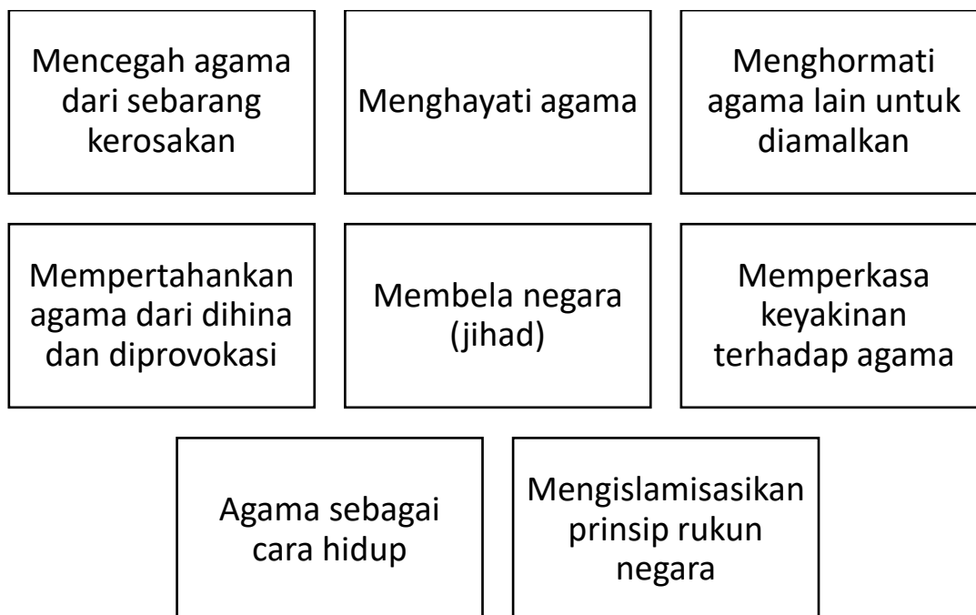
Rajah 2: Elemen Hifz al-Din dalam Patriotisme

Seterusnya, setelah meneliti kajian-kajian lepas dan pandangan dari pakar-pakar akademik, pengkaji menyimpulkan beberapa elemen penting yang boleh disinergikan bersama di antara Hifz al-Din dan juga patriotisme. Berikut rajah di bawah adalah struktur elemen Hifz al-Din dalam patriotisme.