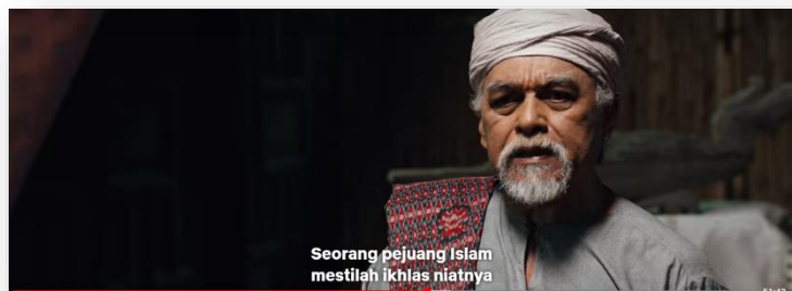
Gambar 4: Minit ke-1:05:25

Mempertahankan tanah air bermakna sanggup berkorban demi kemerdekaan dan kegemilangan masyarakat. Rasa cinta kepada bangsa dan negara, bangga dengan identiti perlu ada sebagai kekuatan untuk menjadi insan yang lebih baik. Orang yang peduli akan tanah air akan sentiasa cakna terhadap keselamatan tempat tinggal dan kampung halamannya. Masyarakat yang mempunyai semangat patriotisme berpaksikan Islam akan sanggup untuk mengorbankan harta atau apa sahaja yang berharga buat dirinya. Mempertahankan tanah air daripada segala ancaman dari dalam dan luar sehingga mengorbankan nyawa sendiri menunjukkan kekukuhan jati diri yang dibina. Selain daripada dialog di atas, terdapat juga skrip lain yang mempunyai elemen yang sama. Dialog tersebut adalah seperti: