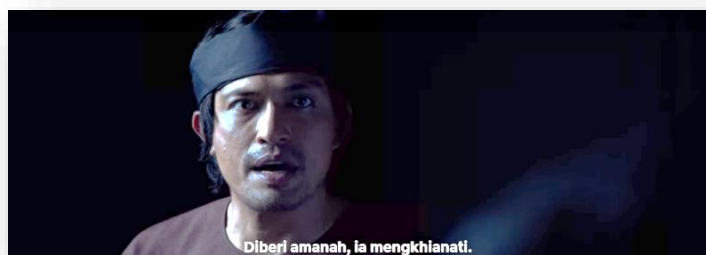
Gambar 7: Minit ke-1:29:51

Daripada filem menunjukkan bahawa sikap khianat terhadap perjuangan dan menjadi tali barut sentiasa ada pada bila-bila masa dan dalam mana-mana bangsa, tanpa mengira pangkat dan warna kulit. Amanah menurut Sahlawati et al. (2017) merupakan satu tanggungjawab yang diberikan dengan tidak mengambil kesempatan menggunakan pengaruh dan kuasa yang ada. Sebagai seorang Muslim yang mempunyai nilai kerohanian tinggi, perlu memiliki sifat malu. Ini kerana menurut Nurzatil Ismah et al. (2017), manusia yang beramanah mempunyai sifat malu dan tidak pecah amanah yang diberikan kepadanya. Dalam tasawuf, perbuatan keji dan