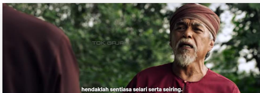
Gambar 1: Minit ke-9:47

Dalam tasawuf kekuatan rohani dititikberatkan. Ia merupakan pendorong kepada kekuatan dan kejayaan fizikal (Safiah, Che Zarrina & Syed Mohammad Hilmi, 2018). Manusia tidak mampu menjadi tonggak kesejahteraan ummah dan keutuhan negara sekiranya pembangunan rohani diabaikan. Aspek pembangunan rohani dapat dilihat pada dialog berikut: