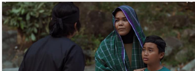
Gambar 8: Minit ke-1:31:48

Melalui filem ini, pengajaran yang boleh diambil ialah sikap suami isteri yang saling memahami dan memberi dorongan mampu membina keluarga yang utuh. Setiap pasangan hendaklah sentiasa bersabar serta bijak mengawal emosi dalam menghadapi konflik atau ujian di samping berakhlak terutama dalam memelihara tutur kata supaya perhubungan yang terjalin menjadi sebahagian daripada resipi kerukunan rumah tangga. Sikap ini selaras dengan ungkapan Ibn Qayyim (1961) yang mana sabar menuntut diri supaya menahan lidah daripada mengeluh dan berkata perkataan yang sia-sia. Al-Makki pula memperincikan sabar dalam memelihara keluarga dengan mengurus dan menjaga ahli keluarga daripada terpesong ke arah keburukan.