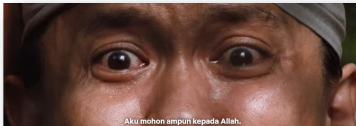
Gambar 2: Minit ke-1:01:04

Selain daripada dialog di atas terdapat juga petikan yang dilakonkan mengaitkan lafaz zikir: