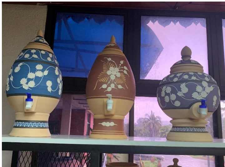
Rajah 4 Labu sayong ala water dispenser dengan reka bentuk tradisional.

“Macam semua orang tahu labu sayong kalau air kita simpan air akan jadi dingin dan dalam fullscale bentuk saiz sebenar bila kita isi atau kita angkat dan kalau kita tonggengkan air itu agak berat, tapi apa team designer buat di sini based kepada kajian kajian sifat mungkin bentuknya sedikit berubah tetapi, sifat asal, kualiti air masih sama, bahan masih sama, cuma form sahaja kita tukar sebagai water dispenser ”. (I8, T1)