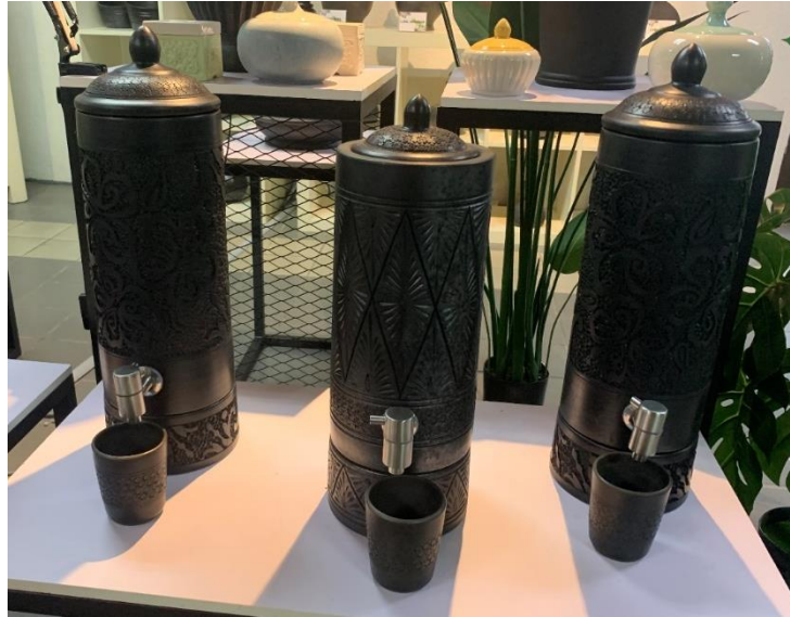
Rajah 5 Labu sayong ala water dispenser dengan reka bentuk moden.

Kumpulan pereka dari Kraftangan Malaysia cawangan Perak telah menjalankan kajian untuk menginovasikan labu sayong tradisional kepada ala water dispenser . Rekabentuk yang baharu tidak memerlukan pengguna untuk mengangkat dan menonggengkan labu sayong yang berat itu, cukup hanya dengan membuka pili air yang disediakan, air dingin daripada dalam labu sayong dapat diperolehi dengan mudah. Selain daripada mudah digunakan, ia juga dapat mengurangkan risiko kemalangan dan lebih selamat untuk kegunaan setiap lapisan umur.