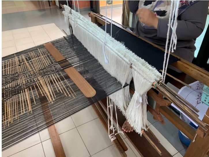
Rajah 3 Alat tenun songket dengan 'heddle eyes'.