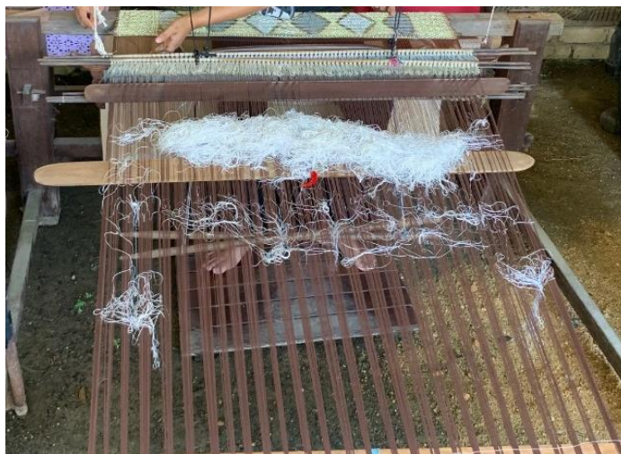
Rajah 2 Alat tenun songket dengan karat kampung.

Oleh yang demikian, satu pendekatan perlu diambil, bagi memastikan permintaan yang tinggi dapat dipenuhi dan dalam masa yang sama, keaslian kraf tangan tersebut dapat dipelihara. Dalam kes penghasilan tenun songket Terengganu, heddle eyes digunakan dalam proses mengarat.