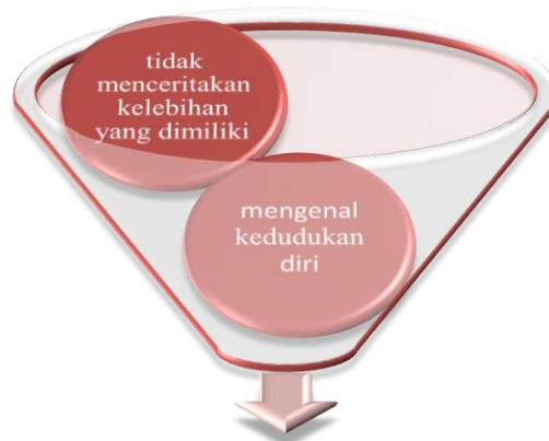
Terapi Merawat Sifat Sombong Menurut al-Ghazali

Dalam merawat sifat ini, al-Muhasibi telah memberi beberapa terapi sebagai penawar dalam membendungnya iaitu penerapan elemen muhasabah (merenung dan menghitung setiap apa yang dilakukan dalam kehidupan seharian), riyadah (latih tubi dalam memupuk sifat-sifat terpuji agar secara perlahan-lahan dapat memupuk sifat-sifat positif seperti takut kepada Allah SWT, pengharapan dan mengingati kematian) dan mujahadah al-nafs (mengekan tuntutan