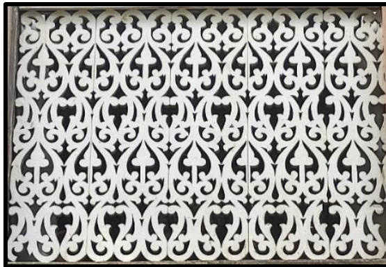
Gambar 3 (b): Ukiran kayu bermotifkan geometri pada bahagian pagar musang