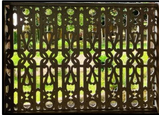
Gambar 3 (a): Ukiran kayu bermotifkan geometri pada bahagian kekisi tingkap

penghasilan bentuk-bentuk segi tiga, bujur, bulat dan piling berganda iaitu huruf 'S' yang disusun secara berturutan pada Rumah Limas Belanda di Terengganu (Mohd Yusof Abdullah, 2021).