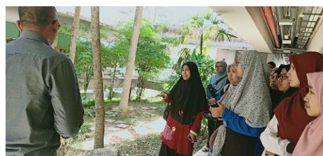
Gambar 3 & 4: Ketua Program Senibina sedang memberi penerangan tentang arca yang dihasilkan oleh pelajar Program Senibina