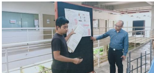
Gambar 5, 6, 7, 8, 9 & 10: Pelajar Program Senibina sedang memberi penerangan tentang proses penghasilan arca