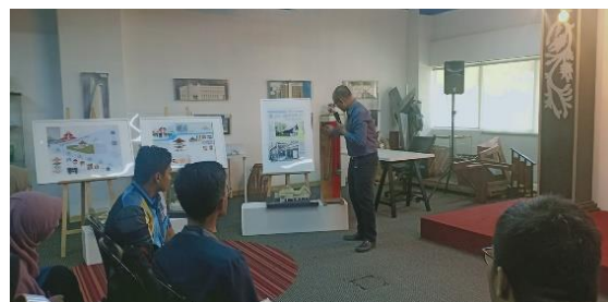
Gambar 1 & 2: Ketua Program Senibina sedang menyampaikan taklimat kepada pelajar kursus Sejarah Kesenian Islam