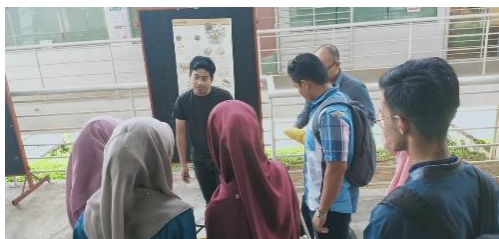
Gambar 10 & 11: Pelajar Program Senibina dan pelajar kursus Sejarah Kesenian Islam sedang berbincang berkaitan proses penghasilan arca