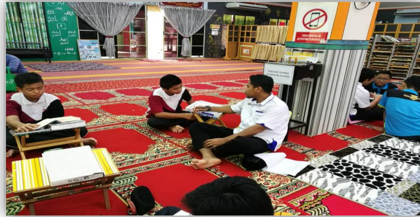
Rajah 2. Kaedah Halaqah di Masjid

IMTIAZ adalah seperti di bawah dengan nisbah pembahagian pelajar adalah 1:5 bagi pelajar yang telah khatam (Kurikulum 2010):