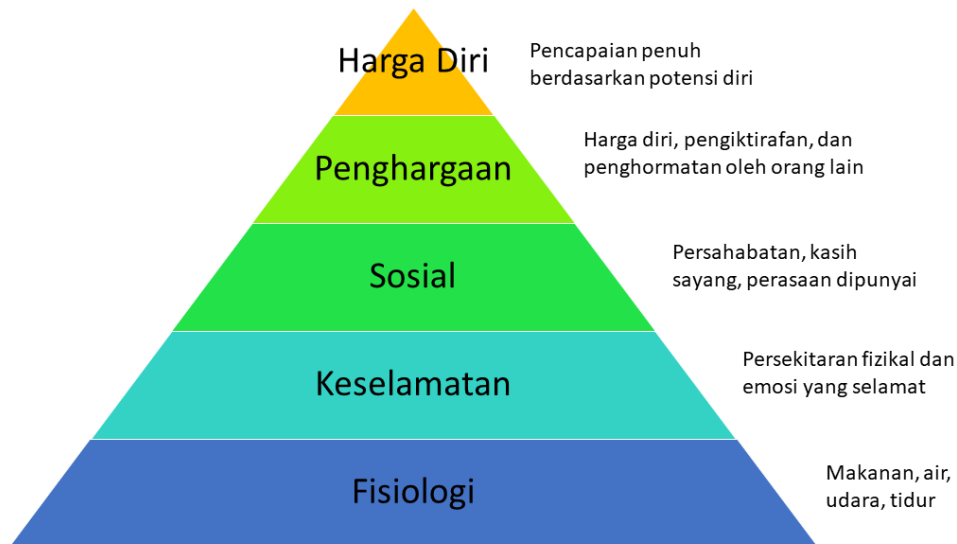
Rajah 1: Piramid Hierarki Keperluan Manusia (Maslow, 1943)

Selain daripada keperluan fisiologi, keperluan kepada keselamatan merupakan keperluan yang kedua. Keperluan ketiga pula merupakan keperluan sosial iaitu keperluan kepada memberi dan menerima kasih sayang. Keperluan keempat ialah keperluan kepada penghargaan terhadap diri sendiri dan menerima penghargaan daripada orang lain. Jika keperluan ini dapat dipenuhi, seseorang akan lebih berkeyakinan. Tahap yang kelima ialah keperluan kepada hasrat diri iaitu kesempurnaan diri. Keperluan ini ialah kebolehan menggunakan sepenuhnya potensi diri dan bakat. Teori ini juga turut menyatakan bahawa setiap keperluan ini hanya akan dipenuhi setelah keperluan paling bawah dipenuhi.