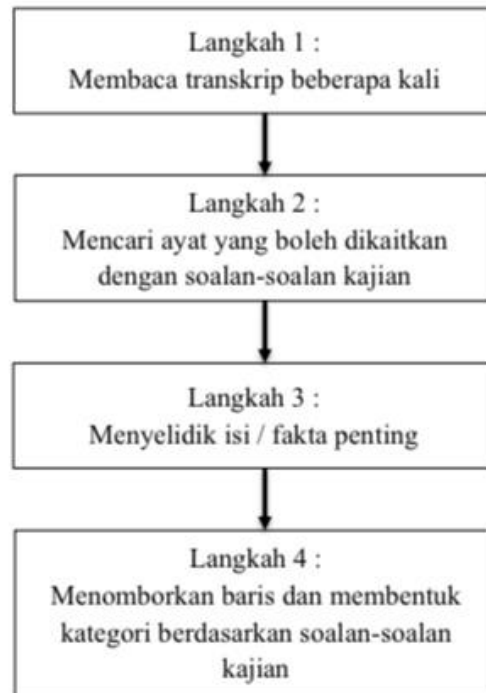
Rajah 1: Proses Memahami Data

yang telah lengkap ditulis dan dibuat indeks sama ada ditulis pada sebelah kiri atau kanan teks. Proses mengindeks transkrip dilakukan dengan melabelkan satu kod tersendiri kepada setiap informan kajian mengikut transkripsinya. Untuk memahami data, data temu bual yang telah dikumpulkan hendaklah difahami bagi memastikan data-data tersebut menjawab persoalan kajian sebagaimana proses yang berikut: