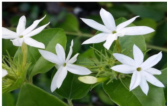
Rajah 3: Bunga Melati

Pantun tersebut mengisahkan bunga melati yang semakin meninggi tetapi keadaan daun pokok tersebut adalah kurang baik, iaitu daunnya hilang kesuburan serta tidak sihat. Bunga melati sangat popular dalam kehidupan masyarakat Melayu, Betawi, Jawa, Sunda, Madura dan Bali kerana ianya dianggap melambangkan kesuburan, kesejahteraan dan kemakmuran. Seperti bunga melati yang gugur dan tidak sihat, orang Melayu mengaitkan sifat atau keadaan bunga melati tersebut dengan kehidupan manusia secara realiti, iaitu perempuan yang telah tercemar maruah dan kesucian dirinya. Orang Melayu menggunakan simbol ‘bunga melati’ sebagai lambang yang merujuk seorang gadis. Seperti yang dinyatakan sebelum ini, bunga merupakan lambang sejagat ( universal sign ) yang merujuk gadis atau wanita (Wan Abdul Kadir, 1992: 5).