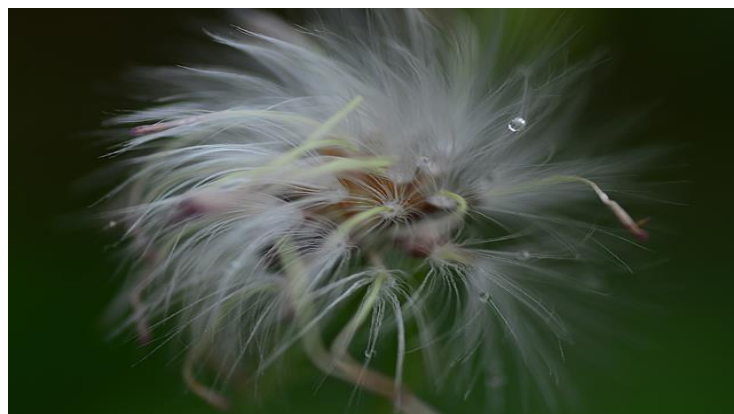
Rajah 4: Bunga Lalang

Bunga lalang dalam pantun tersebut melambangkan “orang yang riak”. Hal ini adalah disebabkan wujudnya persamaan objek dan makna dalam pantun tersebut yang membawa konsep “tegak”. Sifat lalang yang mendongak (tegak) dianalogikan dengan sifat “riak” yang secara tersirat turut mengandungi konsep “tegak” dalam pencirian maknanya. Seperti yang dinyatakan sebelum ini, simbol lalang mendukung makna kontras dengan sifat padi yang sentiasa menunduk. Perbandingan yang terdapat dalam peribahasa “baik membawa resmi padi, daripada membawa resmi lalang” juga adalah berdasarkan anatomi kedua-dua tumbuhan ini. Pada pandangan mata kasar, tumbuhan padi dan lalang mempunyai ciri fizikal dan rupa yang hampir sama, namun kedua-duanya berbeza dari segi fungsi dan kegunaannya. Padi merupakan sumber rezeki, manakala lalang dianggap sebagai tumbuhan perosak yang tidak berguna. Hubungan antara tumbuhan yang memberikan hasil dengan tumbuhan perosak menyebabkan masyarakat Melayu pada masa lalu menggandingkannya sebagai objek perbandingan. Sesuai dengan peranannya, padi disinonimkan dengan sifat positif, manakala bunga lalang disinonimkan dengan sifat negatif.